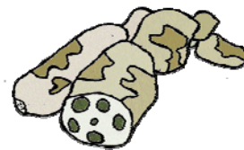
愛西市のレンコン