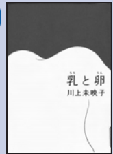
【第138回受賞作】 『乳と卵』川上未映子/著 (文藝春秋2008)