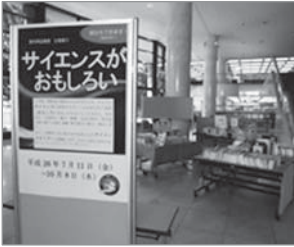
1階ロビー展示会場

愛知県図書館が所蔵する120万冊の資料のうち、40万冊が1～4階に種類・内容別に並べられ、自由に手にとっていただけます。「ビジネス情報コーナー」、中高生向きの本を集めた「ティーンズコーナー」、在住外国人の方のための「多文化サービスコーナー」なども設置しています。