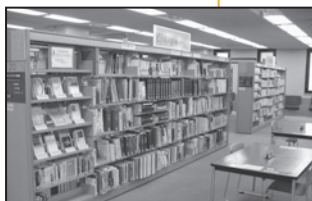
4階ビジネス情報コーナー