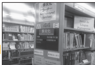
3階多文化サービスコーナー