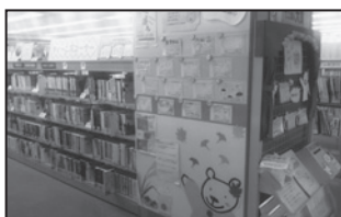
3階ティーンズコーナー