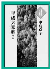
『平成大家族』(大活字本シリーズ)上・下 中島京子/著 埼玉福祉会(2012)