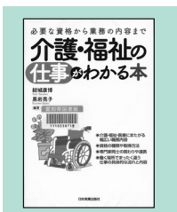
『介護・福祉の仕事がわかる本』日本実業出版社(2012)

* 書名の後の( )内は分類番号で、資料の場所を表します。「ヒモ」はビジネス情報コーナー職業・資格の本です。