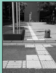
地下鉄丸の内駅のホームから愛知県図書館の中まで点字ブロックで繋がっています。

もし、この上に自転車や車、荷物などが置かれていたら…気づかずにぶつかって怪我をしてしまうこともあります。街を歩くと、点字ブロックの上に停めてある自転車などを見かけますが、これは視覚障害者にとってはとても怖いことです。ぜひ身近な駅や道路で点字ブロックを意識して生活してみてください。