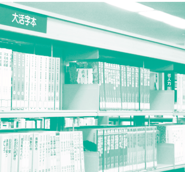
3階大活字本コーナー