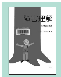
『障害理解』誠信書房(2005)