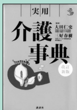
『実用介護事典 改訂新版』講談社(2013)