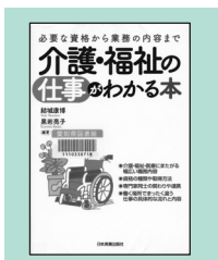
『介護・福祉の仕事がわかる本』日本実業出版社(2012)

* 書名の後の( )内は分類番号で、資料の場所を表します。「ヒモ」はビジネス情報コーナー職業・資格の本です。