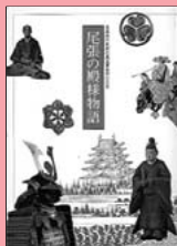
『尾張の殿様物語』 徳川美術館(2007)