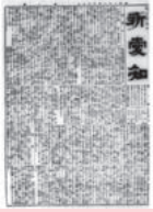
『新愛知』創刊号 明治21年7月5日