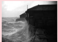
『愛知県政ニュース映画』より 昭和34年 伊勢湾台風特報

蟹江町北部の須成地区に伝わる須成祭。荘厳で華麗な「宵祭」、 「朝祭」の様子を収録した映像資料です。