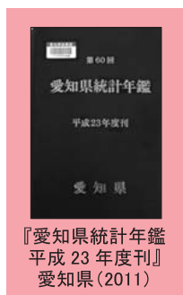
『愛知県統計年鑑 平成23年度刊』 愛知県(2011)