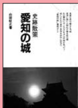
『史跡散策・愛知の城』山田柁之/著・出版(1993)