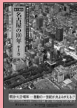
『目で見る名古屋の100年』上巻 郷土出版社(1999)