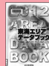
『東海エリアデータブック 2012』中日新聞社出版部(2011)