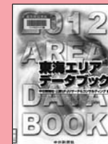
『東海エリアデータブック 2012』中日新聞社出版部(2011)