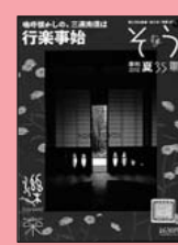
『叢』2012夏号 春夏秋冬叢書