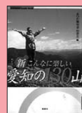
『新・こんなに楽しい愛知の130山』 風媒社(2003)