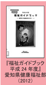
『福祉ガイドブック 平成24年度』 愛知県健康福祉部(2012)