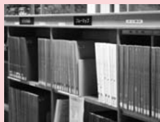
住宅地図コーナー(1階)

* 最新版は、いずれも1階にあります。 地域により所蔵年代は異なります。図書館ホームページ内「 便利な所蔵一覧 」で詳しい所蔵状況をご確認いただけます。