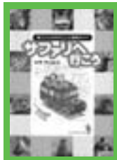
「サファリへ行こう」 ヒサ クニヒロ／著 JTB パブリッシング 2008